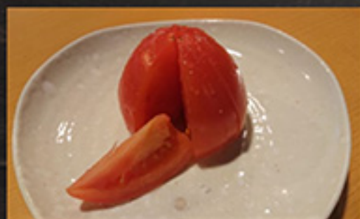
26 chilled tomato 390