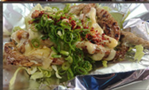
23 せせりチーズ 1,180