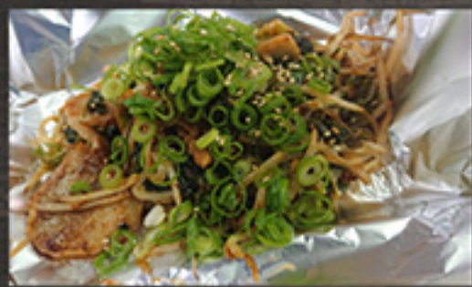
27 豚キムチ 980