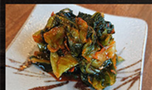
25 Hiroshima Rapeseed Kimchi 390