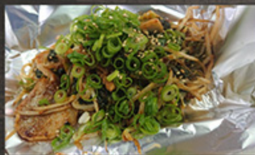
27 Pork Kimchi 980