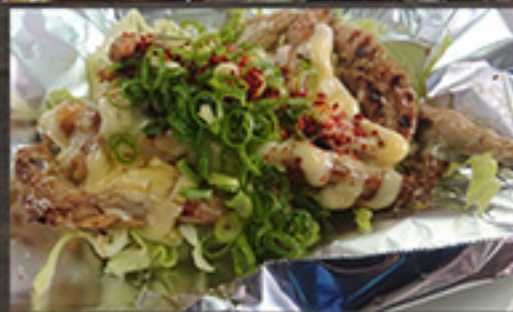
23 chicken neck meat Cheese 1,180