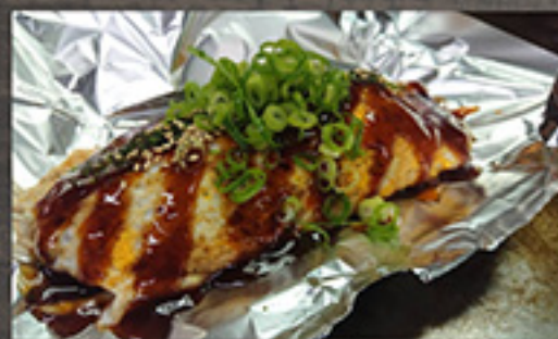
28 Easy Okonomiyaki 880