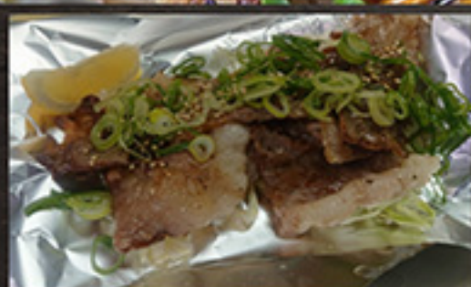
22 コウネ(A5和牛使用) 1,180