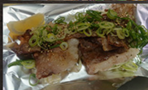
22 Kōne (A5 Wagyu use) 1,180