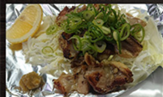
21 Chicken giblets 980