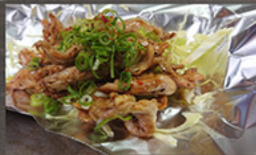
24 Chicken neck meat 880